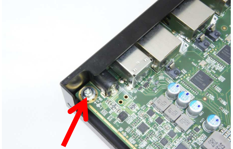
ケース下に基板を取付 4箇所ねじ止めする