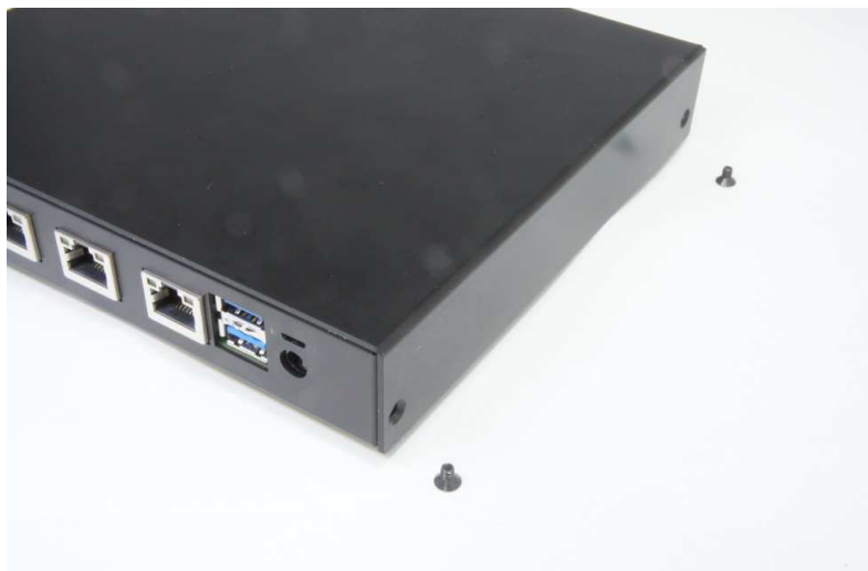
ケース上・ケース下をはめる 4箇所ねじ止め