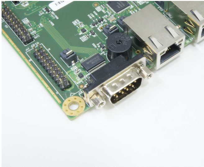
D-SUBコネクタ 取り付けねじを外す