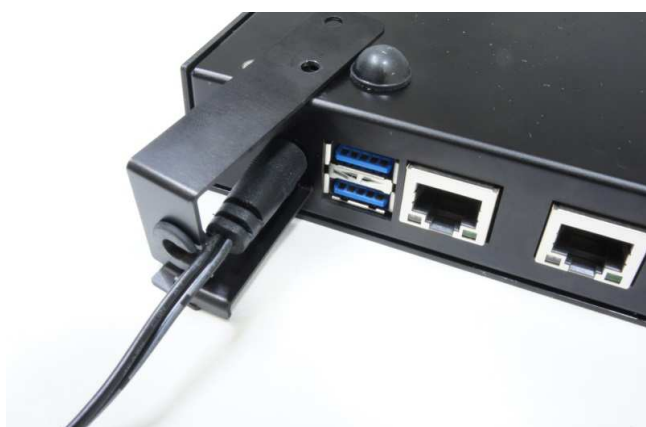
止め金具Bをスライドさせて止め金具A・電源コードに入れる