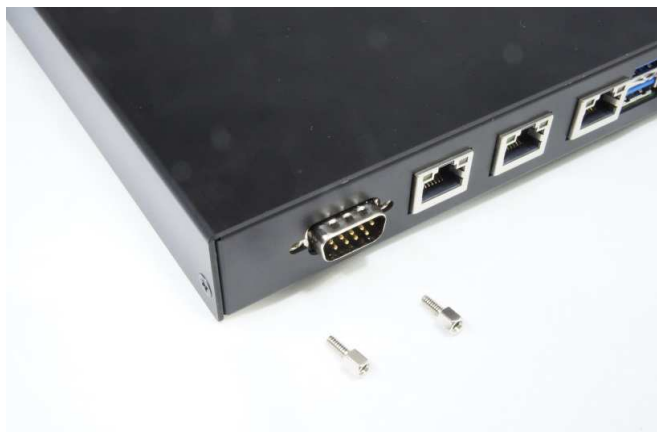
D-SUBコネクタ 取り付けねじを止める