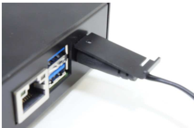
止め金具Aを差し込む