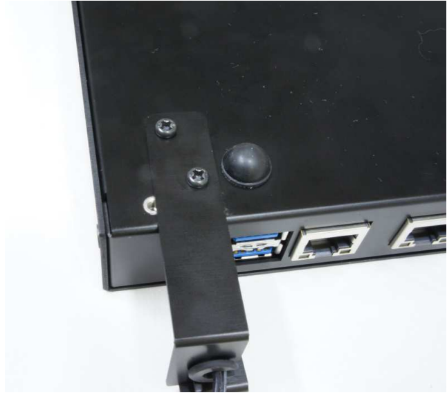
止め金具B 2箇所ねじ止め